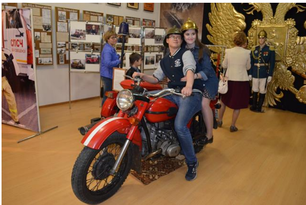
Семейный экипаж пожарного мотоцикла

Некоторые солидные главы семейств поначалу смущенно отнекивались от приглашения оседлать трехколесного коня, однако блеск в их глазах говорил об обратном. И, поломавшись для приличия пять минут, таки взлетали в седло, причем счастье читалось на их лицах очень даже отчетливо!