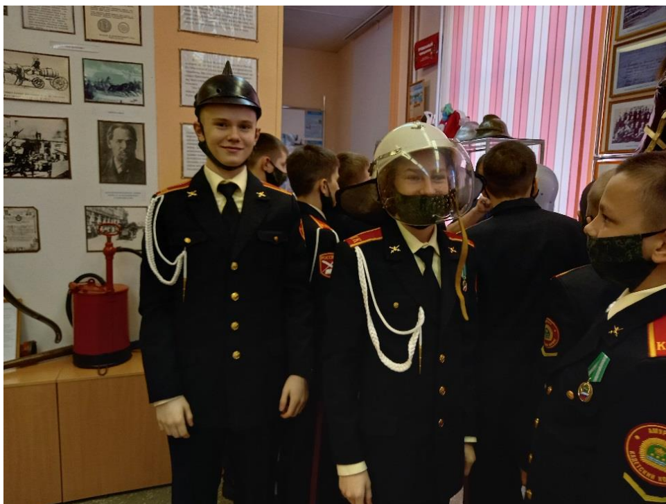
Мальчишки - они и есть мальчишки, даже если и с погонами на плечах...

Мы уверены, что экскурсии в наш музей заставят этих ребят задуматься о том, насколько жизнь прекрасна, и не играть понапрасну с огнем.