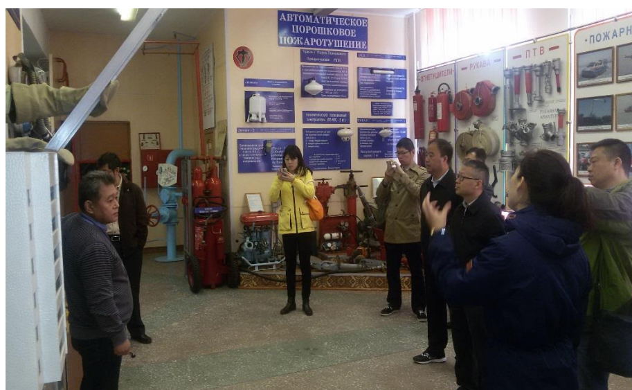
Экскурсия для членов китайской делегации

30 лет назад, переходя на другую работу, я не мог и подумать, что знание китайского языка, который я изучал на восточном факультете ДВГУ, когда-нибудь пригодится мне еще не раз. Нет, конечно, проживание на приграничной территории, турпоездки, шопинг и т.д. предполагают применение полученных в свое время знаний. Но чтобы проводить экскурсии по музею пожарной безопасности на языке соседей – это 30 лет назад казалось мне фантастикой.