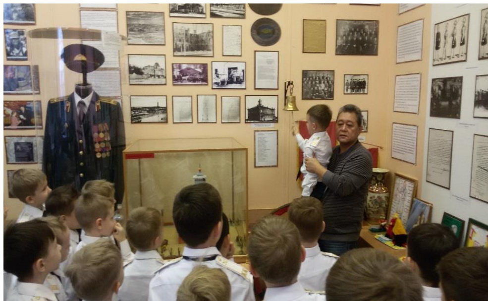
Как знать - может я держу на руках будущего министра обороны...

Начали с самых юных – с 7 классов, которые, по существу, являются первокурсниками.