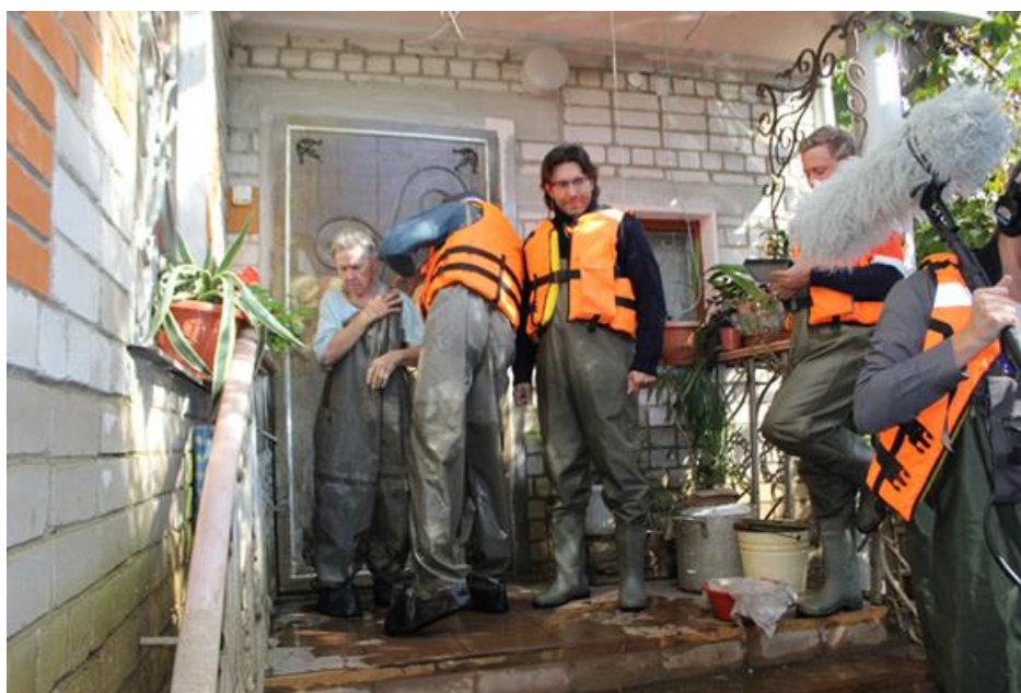
На нем те самые штаны, которые пользуются популярностью среди впечатлительных девушек

После отъезда именитого гостя, данный элемент одежды каким-то образом попал к нам в музей.