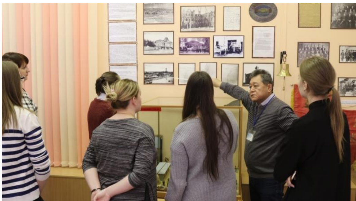
Вспоминается все, даже то, о чем не знал...

На следующий день после 8 Марта у меня на экскурсии побывали девушки – студентки Дальневосточного аграрного университета. Парней из их группы не было, по-видимому, ребята отмечали всемирный праздник мужчин, переживших женский праздник.