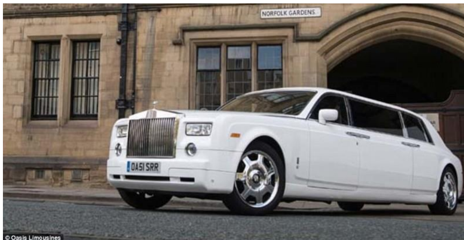
Тот лимузин выглядел примерно так...

Что касается сегодняшнего посещения музея, то ребята с удовольствием осмотрели экспозицию, после чего в нашем небольшом, но уютном видеозале посмотрели мультфильм про мальчика Сеню, который знает, как вести себя правильно в любой чрезвычайной ситуации.