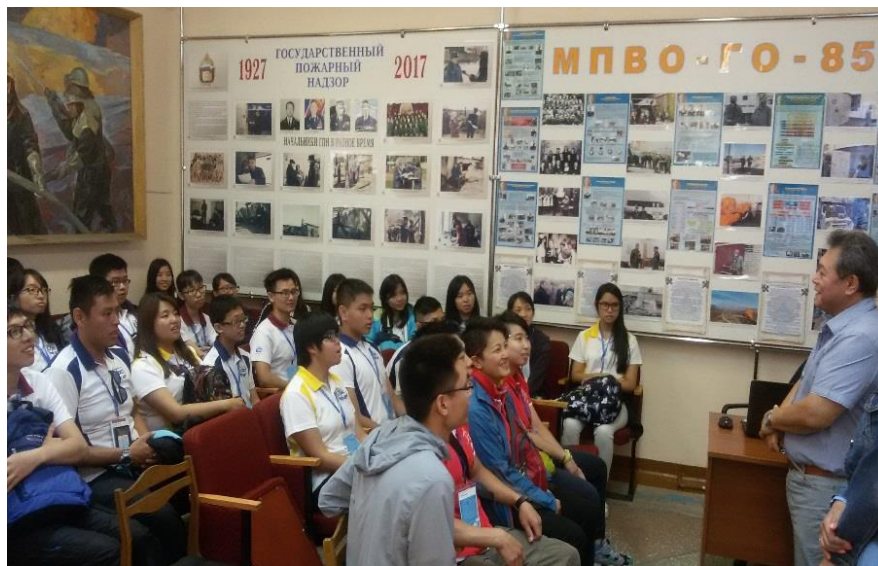
Приятно, когда тебя понимают...

Однако согласно британо-китайской Декларации и основному закону Гонконга, ему, как особому экономическому району Китая, до 2047 года предоставлена очень широкая автономия, вплоть до того, что Гонконг оставляет за собой контроль над законодательством, полицией, денежной системой, пошлинами и иммиграционной политикой, а также сохраняет представительство в международных организациях и мероприятиях.