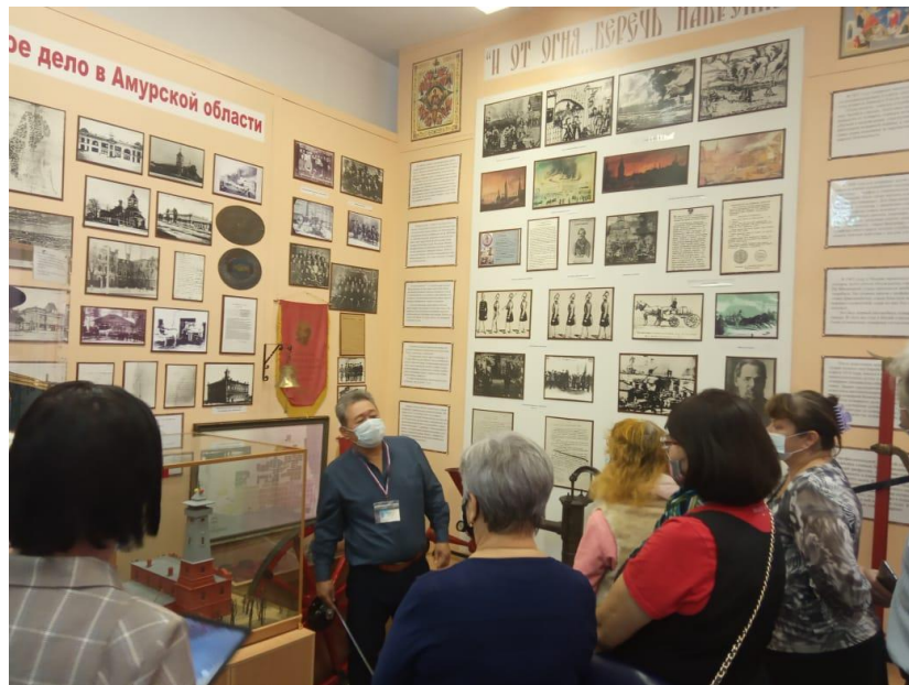
Беседа в историческом зале

Мои гости с удовольствием осматривали экспозицию музея, задавали интересующие их вопросы, фотографировали наиболее интересные экспонаты, фотографировались сами в пожарных касках и на фотозоне.