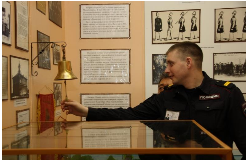
Ударить в пожарный колокол и полицейскому интересно

Впрочем, надо признать, что будущие сотрудники патрульно-постовой и конвойно-охранной службы мало чем отличались от своих сверстников, с неподдельным интересом разглядывая экспонаты музея, особенно действующие макеты.