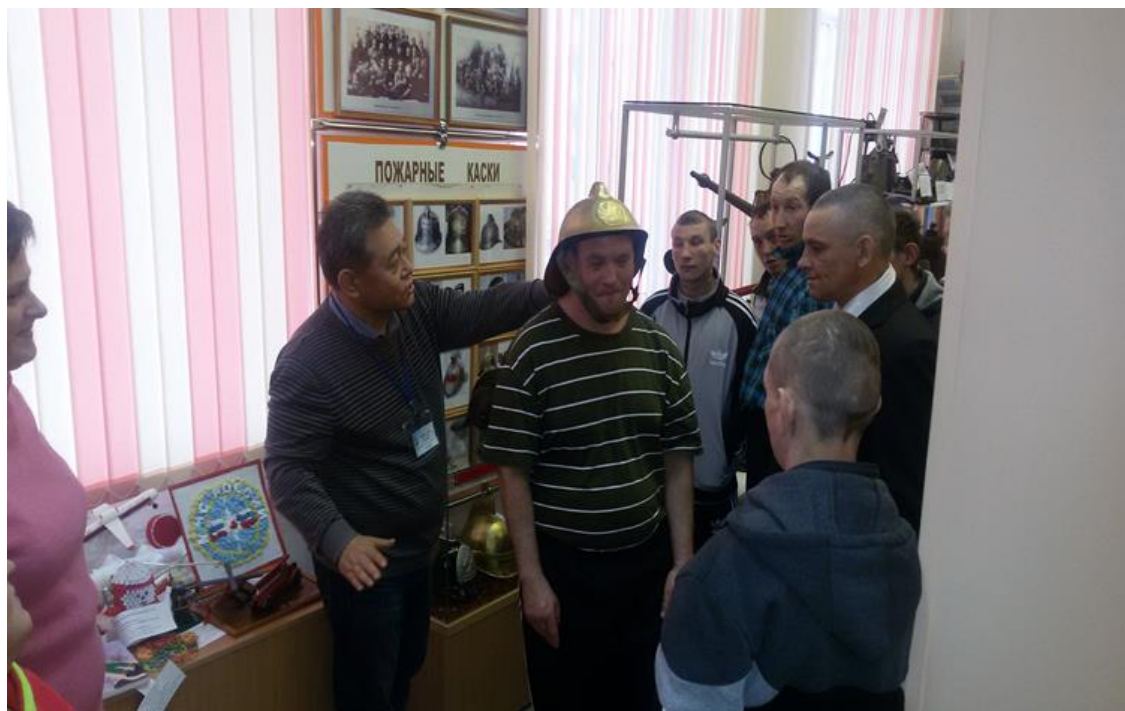
Первая примерка пожарной каски