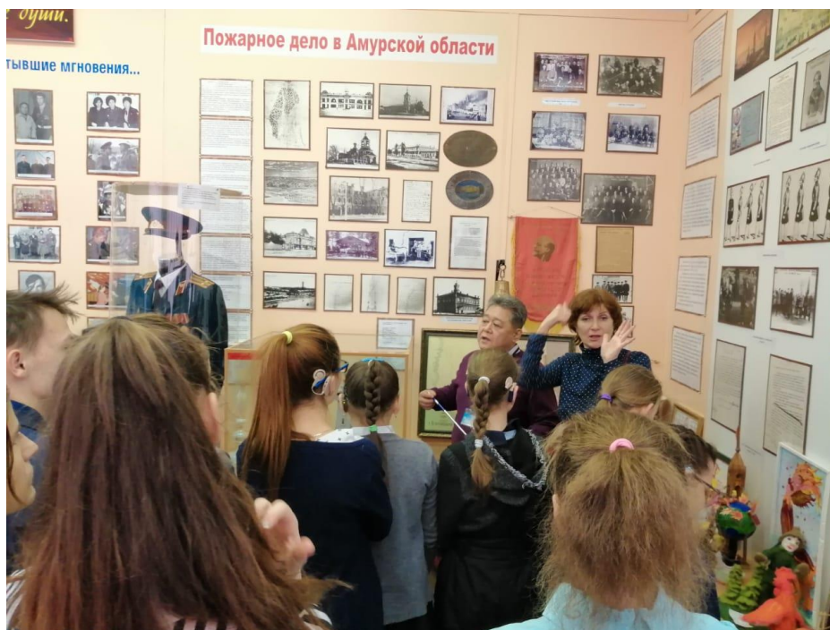
Переводчик - сурдолог обеспечивает связь экскурсантов с экскурсоводом

При проведении экскурсии и во время показа экспозиции с этим контингентом посетителей у нас, безусловно, возникли бы определенные сложности при общении, но, к счастью, ребят сопровождают несколько педагогов, владеющих сурдопереводом.