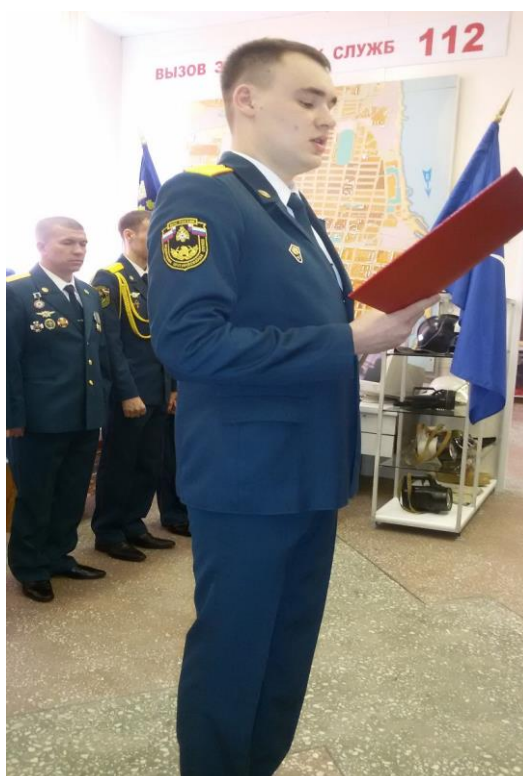
Служа России, служу народу

Ведь сотрудник начинается именно с принятия Присяги. Он клянется, не жалея сил и своей жизни спасать людей из огненной стихии, всегда приходить на помощь тем, кто терпит бедствие, кому угрожает смертельная опасность. Присяга – это показатель гражданской зрелости и готовность к выполнению самых опасных заданий.