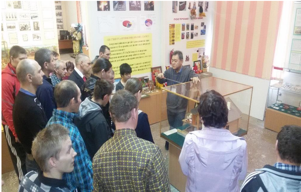
Внимательно слушают о причинах возникновения пожара в частном доме

большим интересом внимали той информации, которой мы сопровождали показ экспозиции.