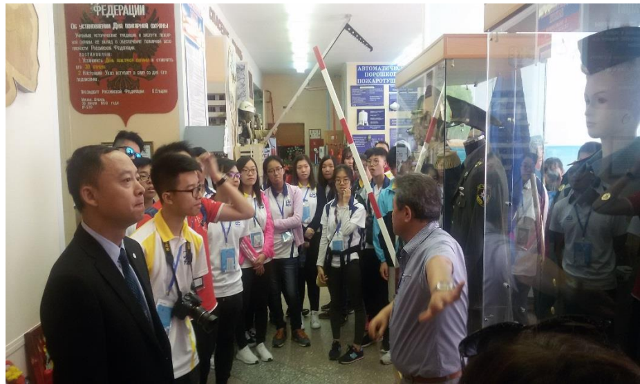
Когда переводчик не нужен...

передать ему от меня большой привет и приглашение посетить наш музей! Ответом на мою просьбу стали смех и аплодисменты.