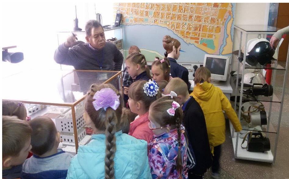
Немного драматизма никогда не помешает

Однако в последнее время мы стали замечать, что наши экскурсанты из «подготовительных» групп ни по возрасту, ни по росту не соответствуют заявленным критериям. То есть, воспитатели из детсадов, безусловно, общаются между собой в социальных сетях или еще как, и нашли практически беспроблемный способ записаться к нам в музей. Звонят, представляются, называют свое дошкольное учреждение, уверяют, что группа подготовительная, и в назначенное время приводят в лучшем случае детей из старшей группы.