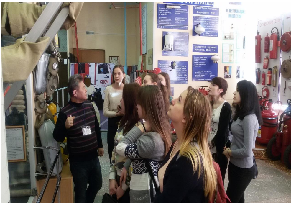
Эх, где мои семнадцать лет...

После традиционного показа фильма-катастрофы, некоторые юные создания попросили меня вместе сфотографироваться на память. И в глубине моей души даже зародилась надежда, что не как с музейным экспонатом.