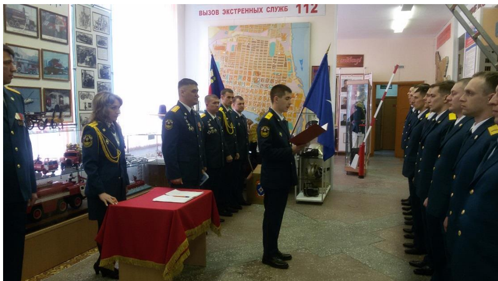
Принятие присяги молодыми сотрудниками МЧС в музее

27 апреля эти слова впервые за годы моей работы в МЧС прозвучали под сводами музея. Вполне счастливое число «13». Именно столько молодых сотрудников пожарной охраны Благовещенского отряда Амурской области произнесли их в торжественной обстановке перед лицом своих товарищей.