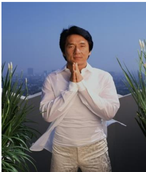
А может, Джеки Чан все-таки выберет время и посетит наш музей

далекого Гонконга с современными боевыми машинами пожарной охраны и их старшими «предками». Кроме того, было бы здорово показать им лабрадоров из спасательной службы.