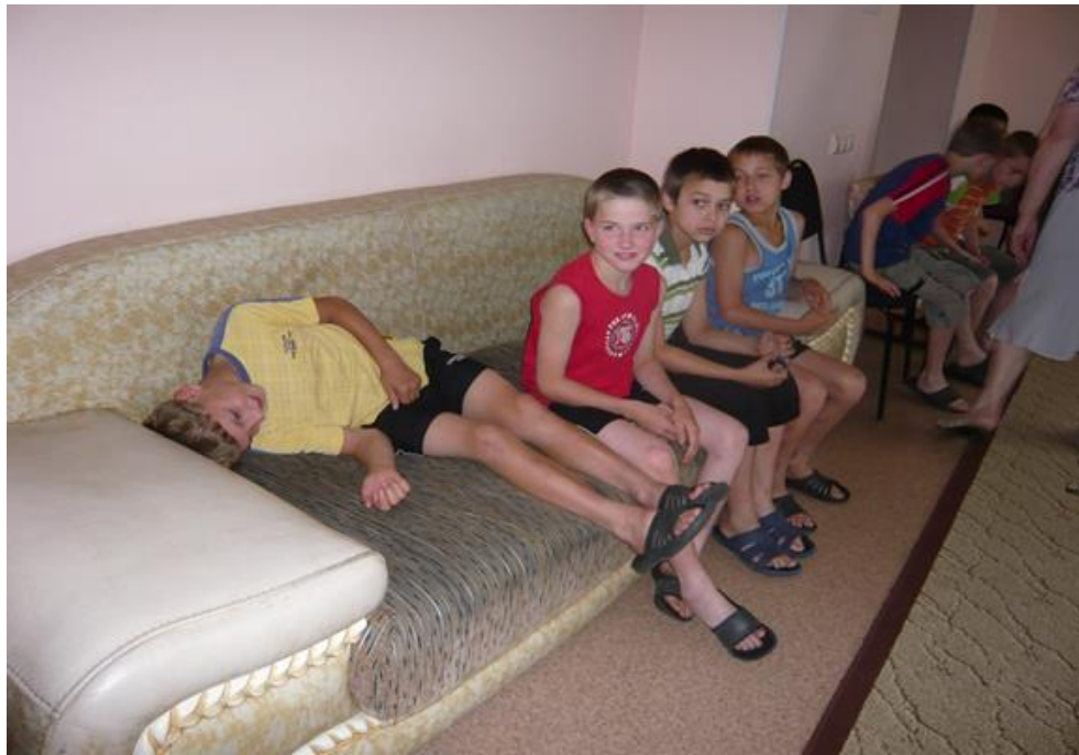
В детском приюте...

Остается добавить, что в 2016 году все мероприятия проходят в рамках Года пожарной охраны в МЧС России.