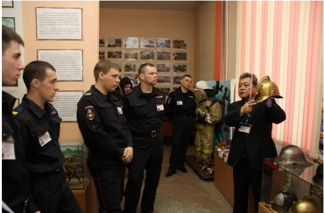
Глядя на них - вспоминаю себя...

Казалось бы: какая взаимосвязь между пожарной охраной и полицией? А на самом деле, очень даже тесная. Начну с того, что сама пожарная охрана «родилась» в системе МВД России еще в стародавние времена. И находилась в его составе вплоть до 2001 года, когда была присоединена к министерству по чрезвычайным ситуациям. Не случайно, первые пожарные подразделения были дислоцированы при полицейских управлениях. Кстати, так было и в нашем Благовещенске.