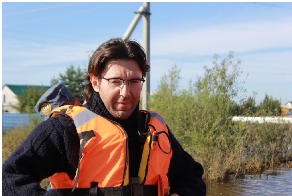
Андрей Малахов в затопленной Владимировке

Чтобы светило российской журналистики смог передвигаться по затопленной Владимировке, ему в помощь выделили нескольких сотрудников областного управления МЧС и, конечно, экипировали соответствующей одеждой в виде штанов типа от ОЗК с сапогами.