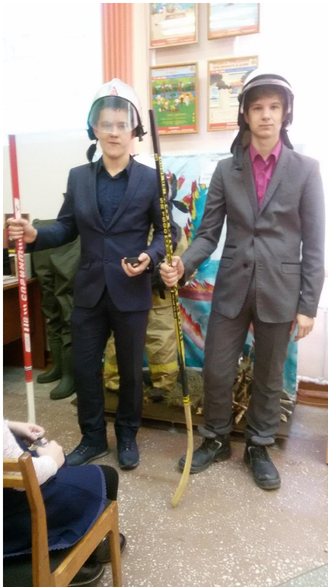
Получить подарок - всегда приятно