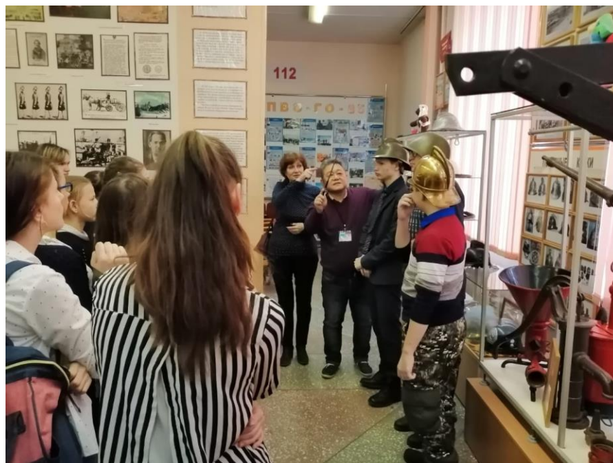
Эти ребята отличаются своей серьезностью