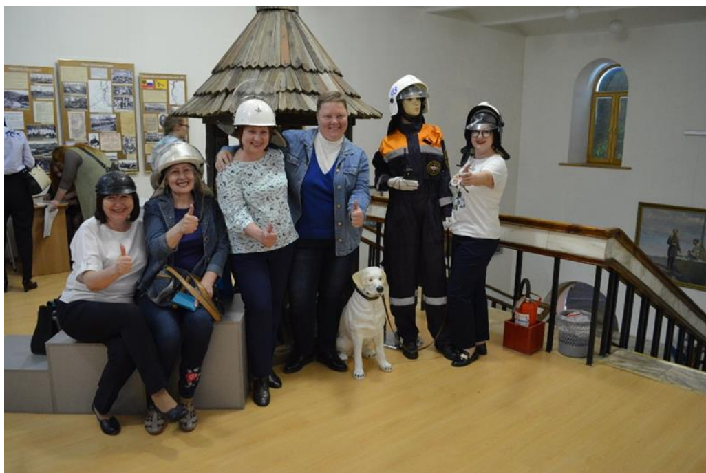
Учителя тоже обладают чувством юмора

Конечно, помимо мотоцикла мы представили еще около 10 экспонатов музея пожарной охраны. Это три манекена: брандмейстера, пожарного в форме и девушки-кинолога спасательной службы с собакой-лабрадором. Был впервые представлен насос двуручный производства середины прошлого века, несколько старых предметов, имеющих отношение к пожарной охране, три каски под стеклом, как особо ценные для нас, и стенд для фотографирования со специальным отверстием для лица с причудливым названием «тантамареска». Все они также вызвали определенный интерес посетителей.