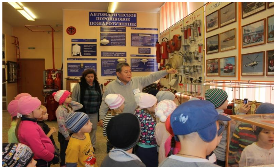
Детсадовцы - самые благодарные зрители

Сегодня у меня на экскурсии были выпускники подготовительной группы детского сада №28.