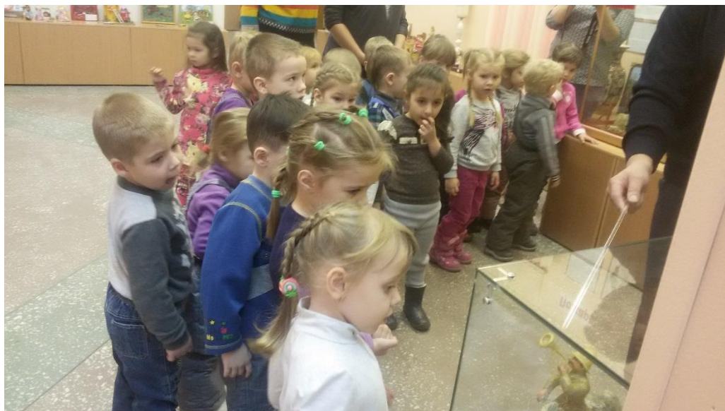
Ребятишки верят каждому слову экскурсовода